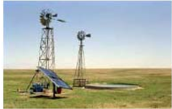
Şekil.1 Pistonlu pompa kullanarak su pompalayan yelkapanlar

Bu çalışmanın amacı, pistonlu pompa ile su pompalayan bu yelkapanların değişen rüzgar hızı karşısındaki davranışlarını incelemek ve aerodinamik verimlerinin rüzgar hızına bağlı olarak nasıl değiştiğini ortaya koymaktır.